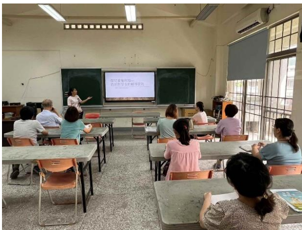
學生輔導與管教研習