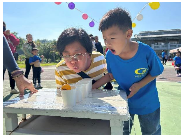
運動會親子闖關活動