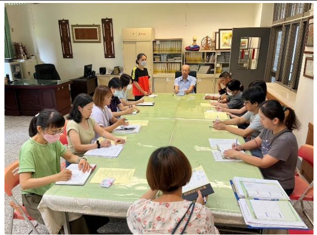
召開 114-1 家庭教育推動委員會