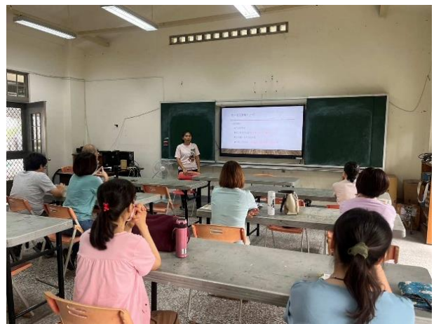
學生輔導與管教研習