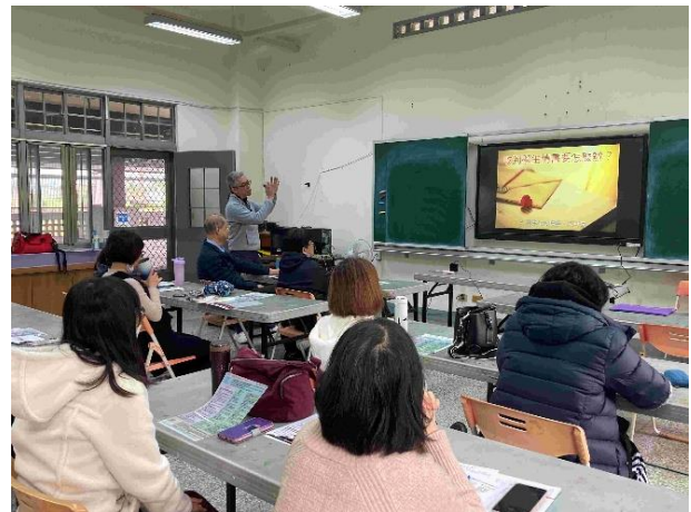
班級經營與輔導研習