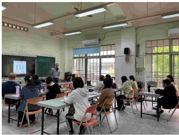
班級經營與輔導研習