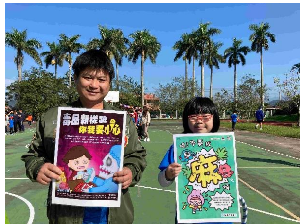
運動會親子闖關活動