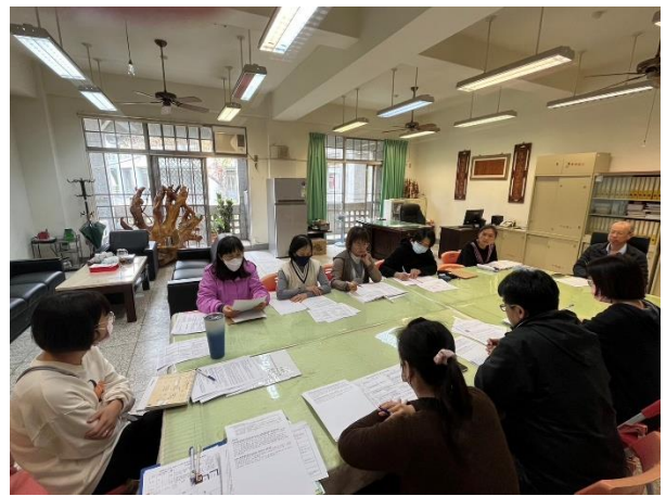
召開 114-2 家庭教育推動委員會