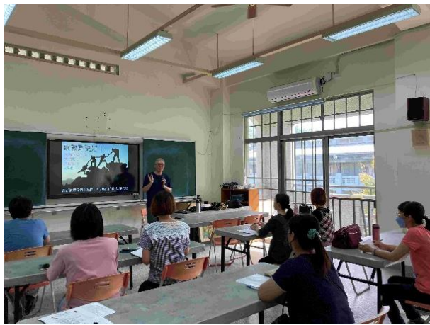
教師正向管教研習