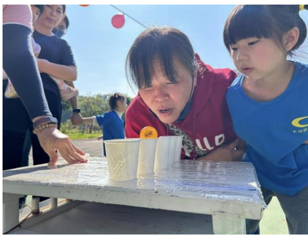
運動會親子闖關活動