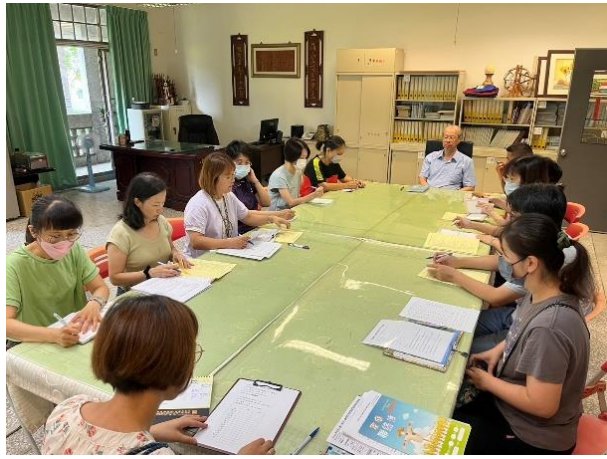
召開 114-1 家庭教育推動委員會