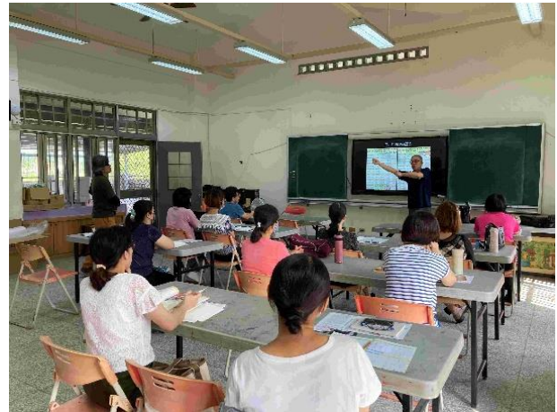
教師正向管教研習