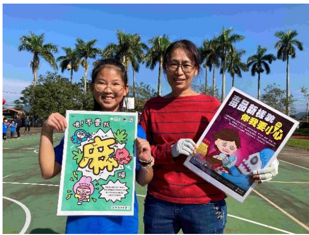
運動會親子闖關活動