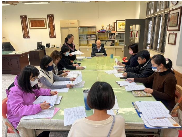
召開 114-2 家庭教育推動委員會