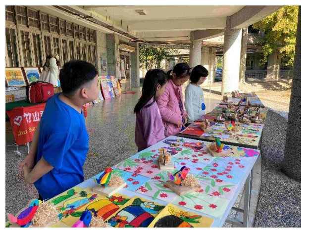
運動會藝文作品展演