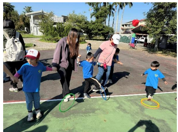
運動會親子闖關活動