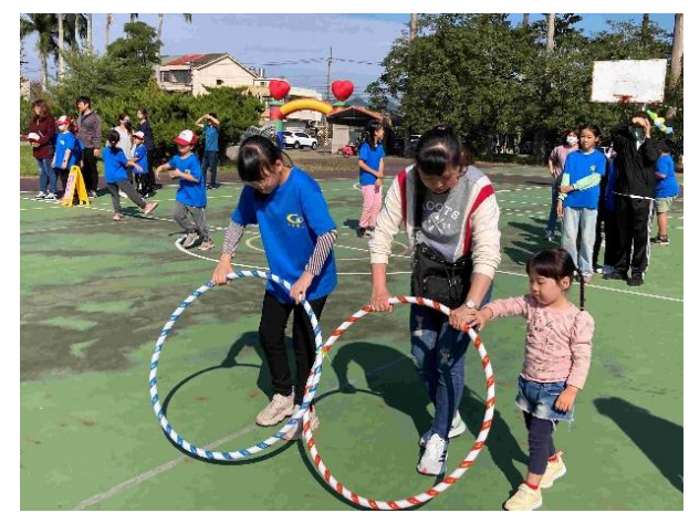
運動會親子闖關活動