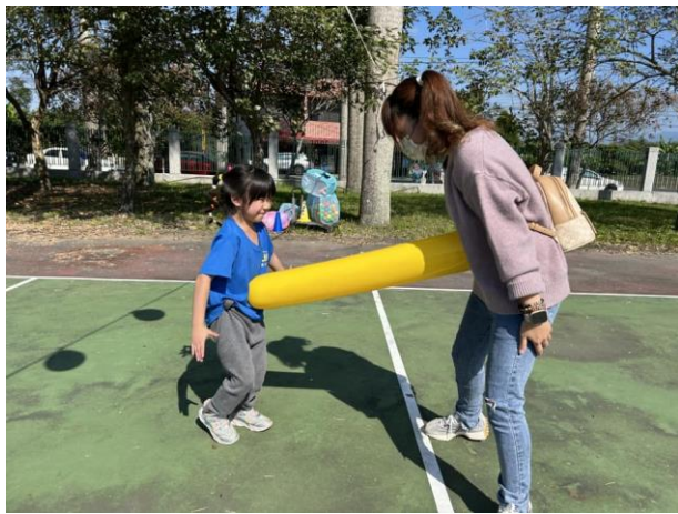
運動會親子闖關活動