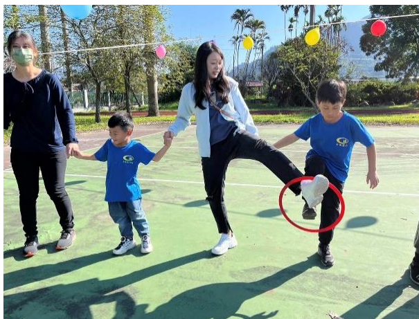
運動會親子闖關活動