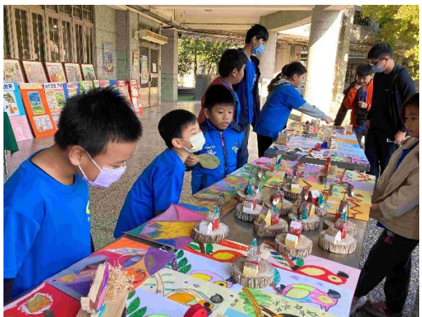
運動會藝文作品展演