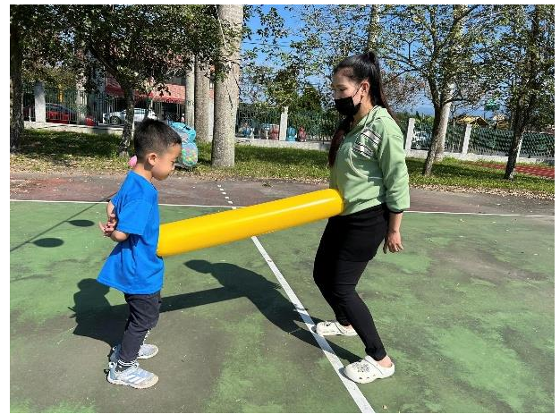
運動會親子闖關活動