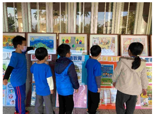
運動會藝文作品展演