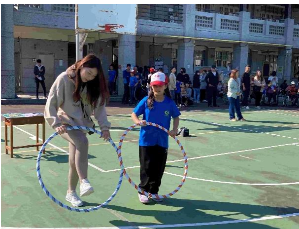
運動會親子闖關活動