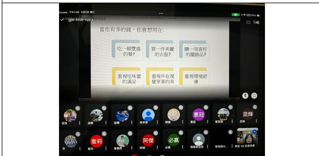
何謂家庭資源介紹