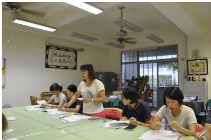
同仁分享家庭教育心得