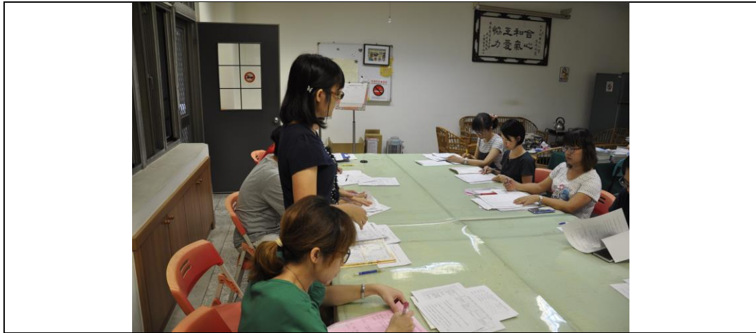
同仁分享家庭教育心得