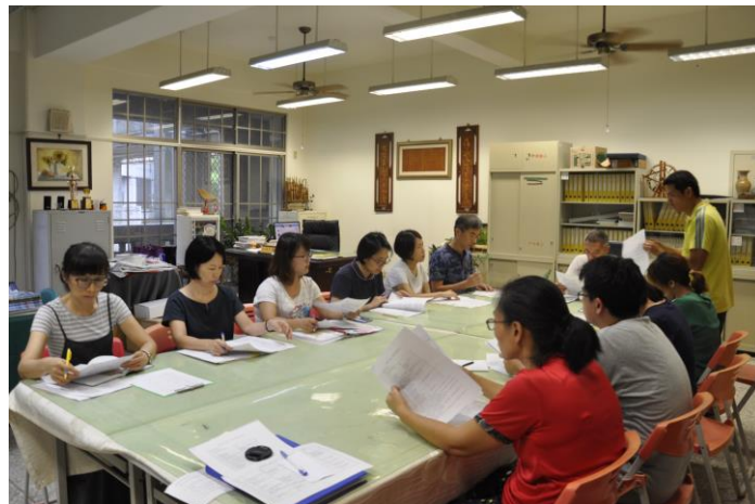
回校分享家庭教育研習資訊