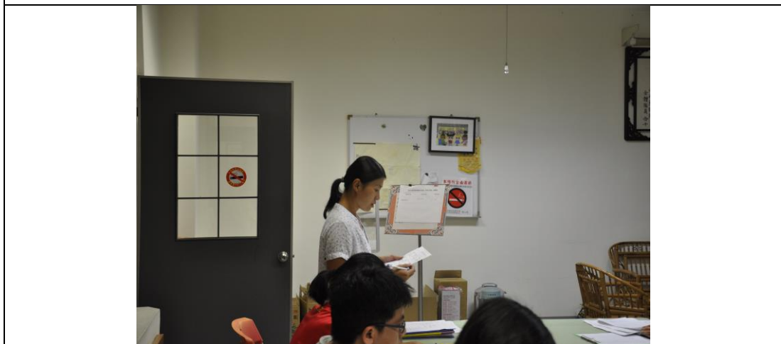
同仁分享家庭教育心得