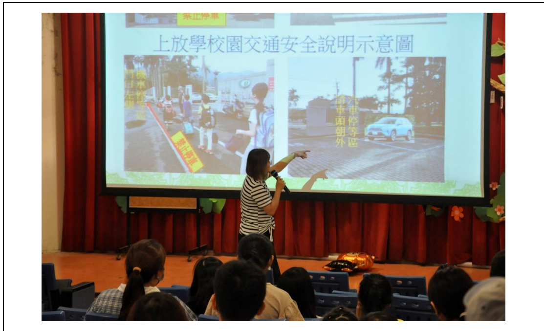
家長接送學生交通安全