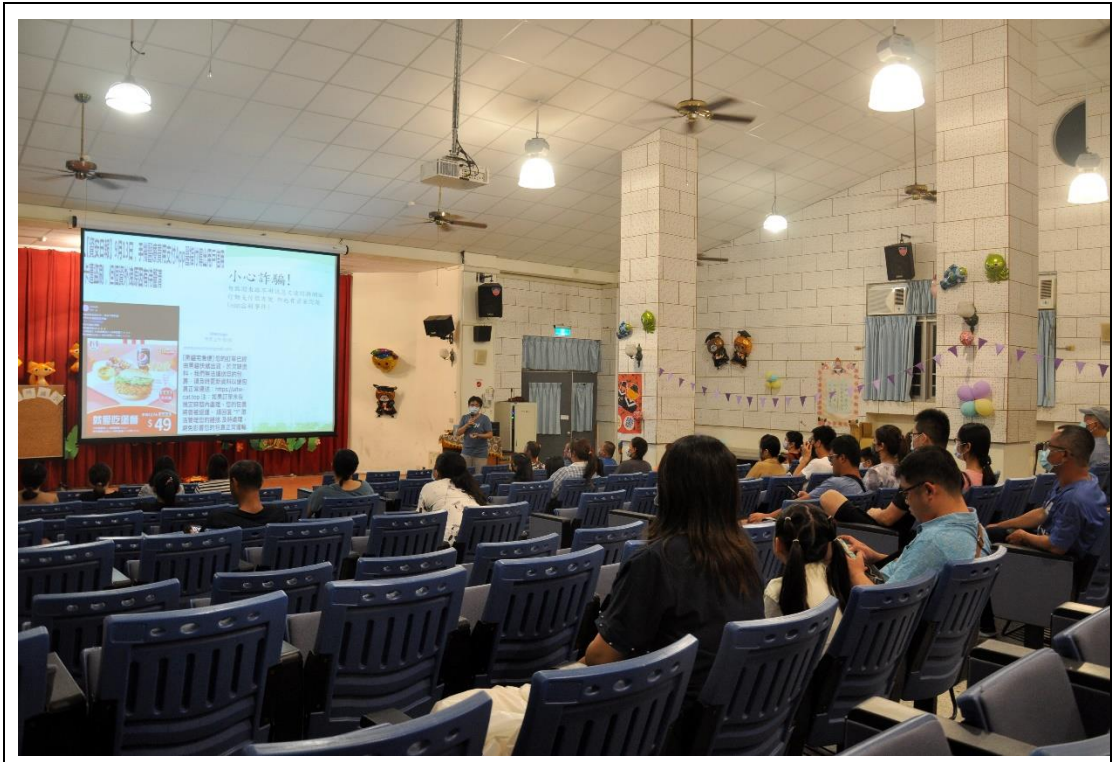
家長親職網路防詐宣導