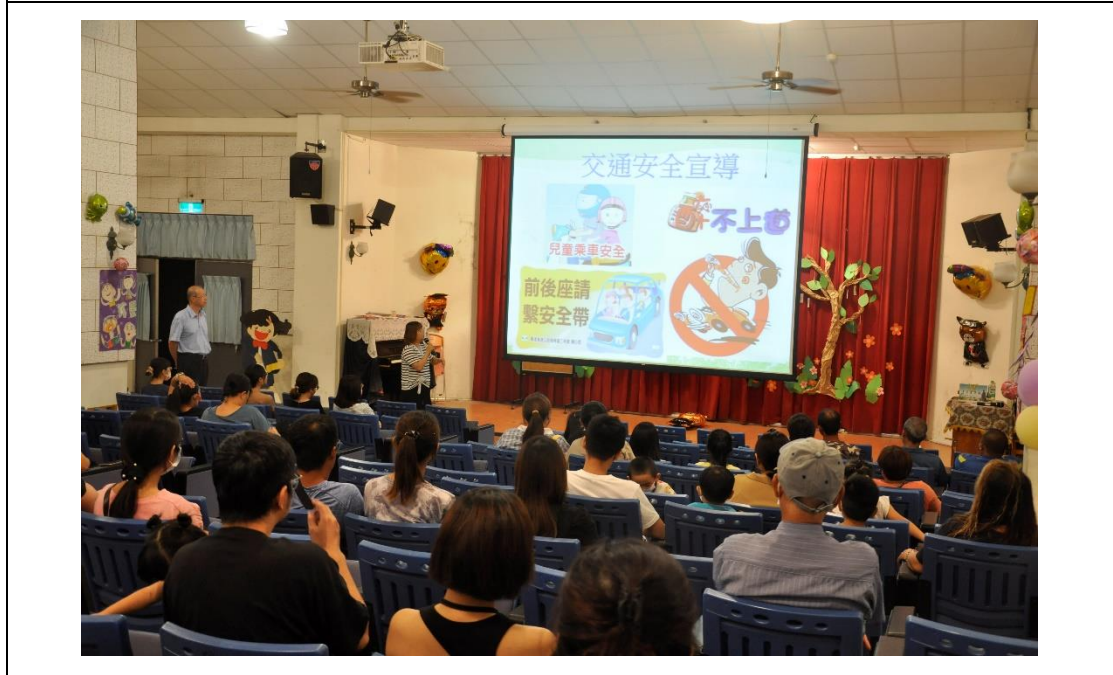
家長日交通安全宣導