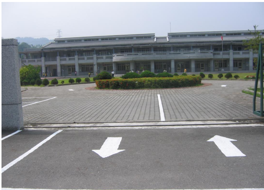
人車分道確保學童安全